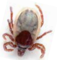
Erwachsene Zecke (Ixodes hexagonus)