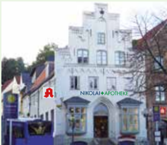
Flensburgs ältestes Haus von 1436

Ab dem 16. Juni bekommt die Fassade der Nikolai-Apo am Südermarkt ein Gerüst und wird neu gestrichen. Auf geht's!