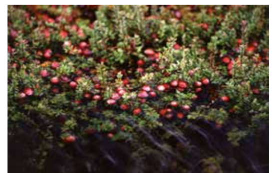
Die „Großfrüchtige Moosbeere“ auch genannt CRANBERRY beugt Blasenentzündungen vor.

Mein Tipp: Cranberry-Kapseln. Streiten sich beim Cranberry-Saft die Gelehrten, wie viele Gläser man am Tag zu sich nehmen soll, so ist das bei den Kapseln einfach dosiert: 1 Kapsel täglich zur Verbeugung. Damit Sie den Sommer genießen können!